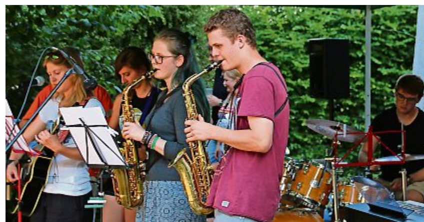
Die Schülerband «the pride».

Lostorf Das erste Open-Air in Lostorf bietet diversen Formationen und Bands der Musikschulen Lostorf, Stüsslingen, Obergösgen, Winznau und der Kreisschule Mittelgösgen eine Plattform, ihr musikalisches Können einem breiten Publikum vorzustellen. Für die Festwirtschaft sind Jugendliche zusammen mit der Offenen Jugendarbeit Lostorf/Obergösgen besorgt. Schülerbands haben in Lostorf und den umliegenden Musikschulen bereits eine längere Tradition. So bestehen alle Bands und Formationen seit mehreren Jahren. Während bei den «4 Elements» die Bandbesetzung seit der Gründung vor vier Jahren unverändert geblieben ist, hat sie sich bei den meisten Formationen zum Teil stark verändert. Neben dem fleissigen Einstudieren,