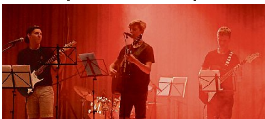
«reloaded seventeen» ist am Open-Air ebenfalls dabei.